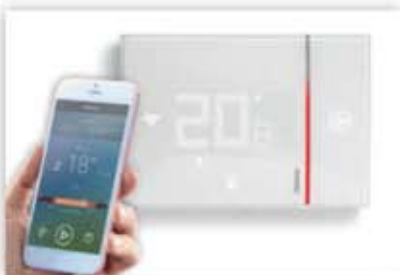
Remote monitoring and management of all kinds of infrastructures