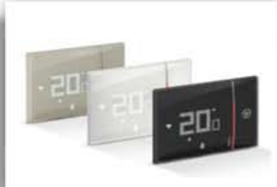
Making power available