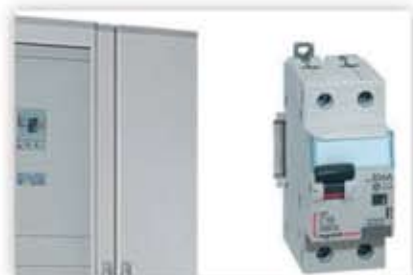
Protecting electrical installations