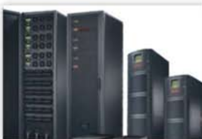
Providing a secure, stable and optimized power supply