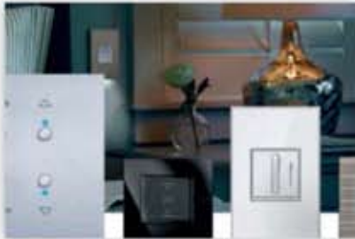
Electrical installation control

The Group's solutions are installed in living environments (individual homes and collective housing, hotels, etc.), working environments (offices, datacenters, industrial sites, etc.) and meeting environments (shops, hospitals, schools and universities, etc.).